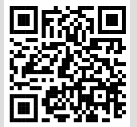
اشتراطات المجمعات الطبية العامة الواجب على المستثمر الالتزام بها