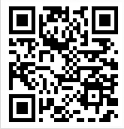
الهوية العمرانية لعمارة مكة المكرمة